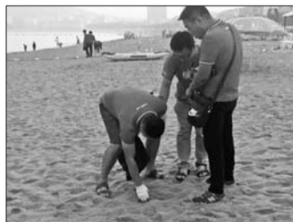
▲志愿者在国际海水浴场开展净滩服务。

19日上午,可口可乐公司员工及志愿者,带着编织袋、手套来到国际海水浴场,拉网式排查、净滩,在沙滩、礁石之间,清理垃圾,现场越来越多的市民加入。组织方还设立了“可口可乐加油站”,为每一位参与净滩活动的志愿者准备了可口可乐系列饮品。经过半个多小时努力,志愿者完成了对沙滩的“扫荡式”清理,清理掉烟头、塑料袋、废旧泡沫板、饮料瓶、鱼网、食品包装盒等各