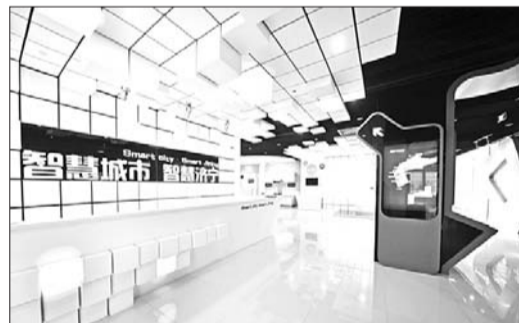
济宁智慧城市体验馆场景

市拥有研发实力雄厚的济宁中科先进技术研究院、中科院计算所济宁分所等科研平台,在智能传感技术、机器人控制技术、人机交互技术等方面具有较强的技术积累,研发出了全方位重载移动机器人、高速并联分拣机器人、雕刻机器人、抛光打磨机器人等。工业机器人的发展对于济宁的工业结构调整和升级具有非常积极的意义。