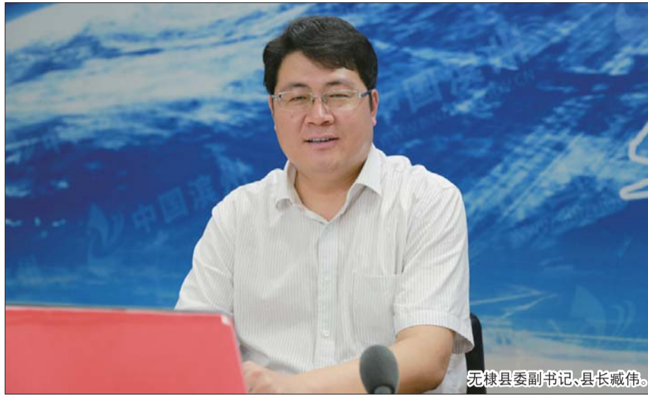
无棣县委副书记、县长臧伟。