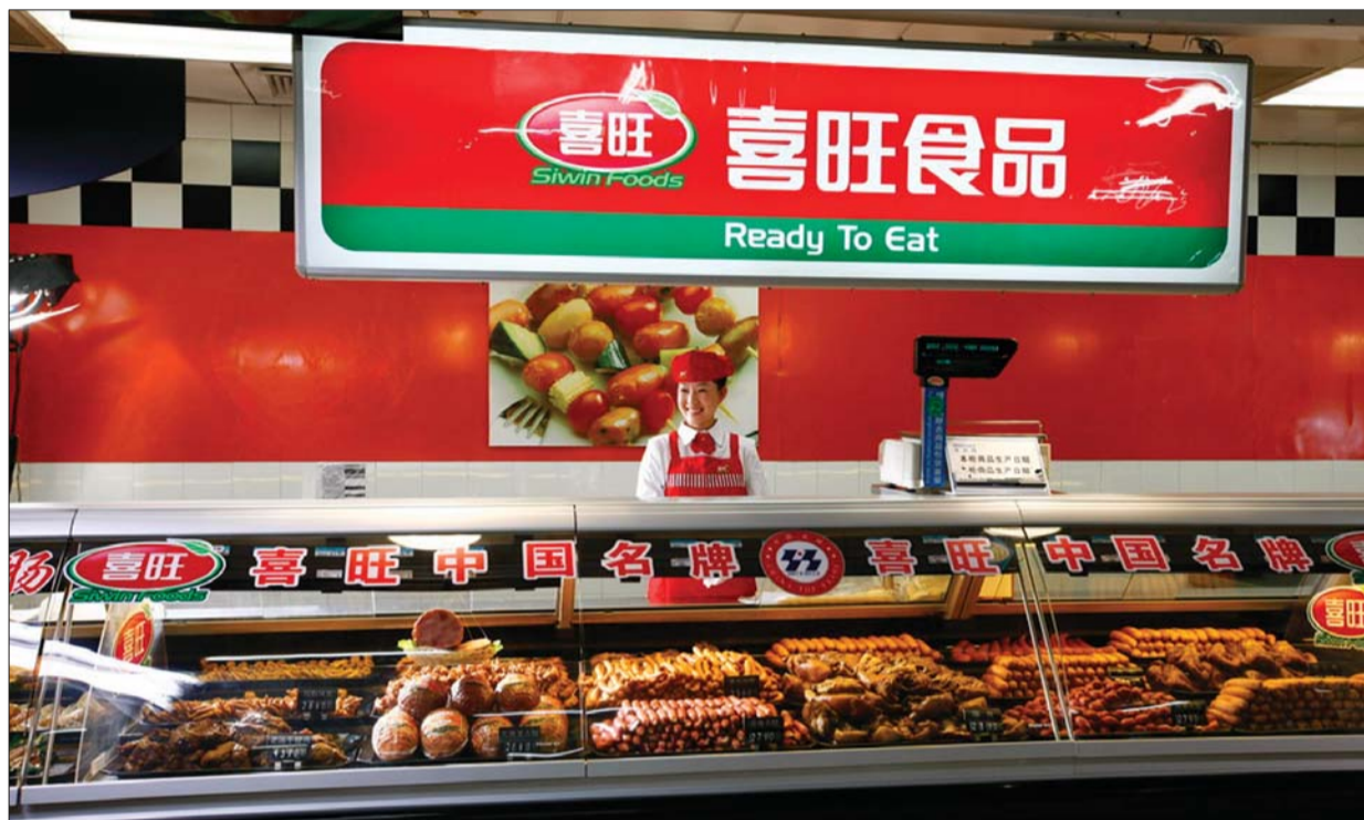
喜旺直营店遍布全省各地。

喜旺公司的源头控制、冷链体系和连锁直营模式,使“喜旺”成为中国低温肉制品的领军企业,这荣誉的背后是喜旺公司对质量的严苛和不懈追求,喜旺对质量的把控究竟“细”到什么地步?近日,本报记者走进烟台市新桥西路的喜旺工业园,探访了喜旺肉制品从原料选择、生产加工,到运输和销售,喜旺的肉制品通过层层把关,成为百姓餐桌上的放心食品。