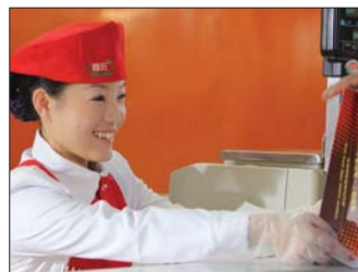
优质服务赢得顾客信赖。

喜旺公司的源头控制、冷链体系和连锁直营模式,也使喜旺成为中国低温肉制品的佼佼者,集团研发中心被认定为“国家农产品加工技术研发专业猪肉领域分中心”、“国家认定企业技术中心”。喜旺,不仅仅是山东省第一个获得国家无公害产品标志的熟肉企业,也是山东省第一家加入世界肉类组织的企业。