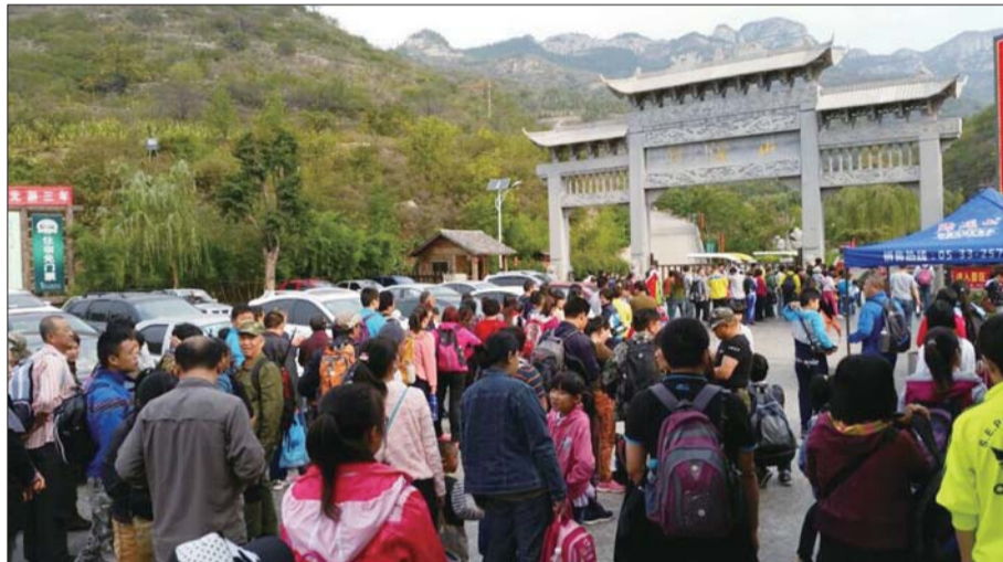
游客前往潭溪山景区游玩。(资料片)

今年“十一”假期是国家旅游局发布的《景区最大承载量核定导则》实施的第一个黄金周,淄博不少景区游客不到最大承载量一半,景区远远没有“吃饱”。从数据上看,淄博接待游客数量每年都在增长,旅游收入也是节节高,但在经济转型的大背景下,旅游业越来越受到重视,而淄博旅游面临的缺少品牌、难形成合力等问题仍亟待破解。