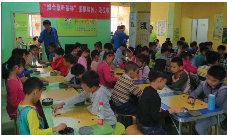
2015“烟台桑叶茶杯”围棋级位、段位赛。

围棋的传统赛事,由烟台市芝罘区围棋协会主办,丹朱围棋教室承办,烟台桑叶茶赞助,旨在展示围棋技艺,弘扬传统文化、发扬时代竞技精神,提倡良好的棋德棋风,增添棋友博弈乐趣,深受广大棋友、学生及其家长的喜爱。