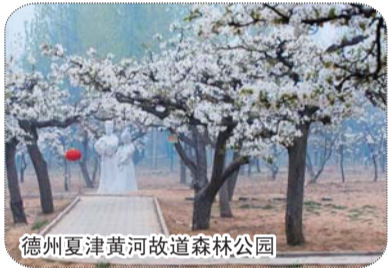
德州夏津黄河故道森林公园