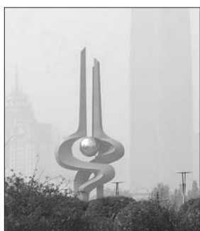
15日,雾霾重回济南。

本报济南10月15日讯(记者刘德峰 见习记者 郭立伟) 10月15日上午,雾霾再袭济南市区。数据显示,上午11时,济南的空气质量指数(AQI)达到了226,为重度污染状态。与此同时,菏泽、聊城和德州等多地也陷入较为严重的空气污染之中。