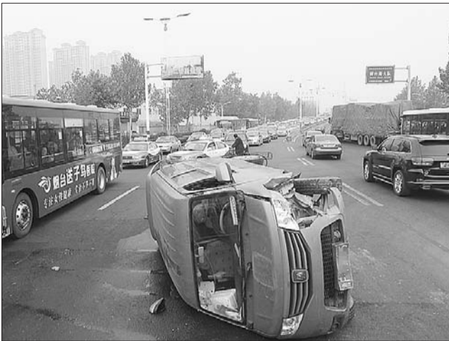
面包车发生侧翻。

民警提醒驾驶员,变更车道前,应提前开启转向灯,注意观察前后左右方向的车辆,保持安全距离,再进行变更车道。