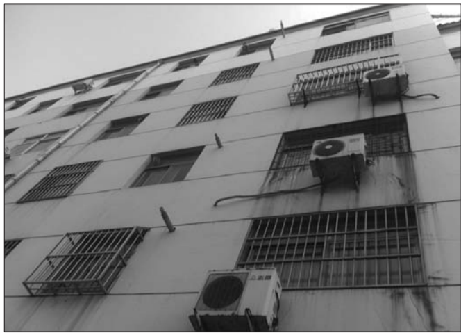
一些业主安装燃气壁挂炉后不愿再花钱改造集中供暖。

暖的事情更加没人管,没法实现集中供暖,天气冷的时候虽说可以开空调,但空调总不能一天24小时一直开着,而且小区也是老小区,没有外墙保温层,空调稍微关一会,屋里温度就会随之下降。“住了这么多年了,一开始也盼过集中供暖,可现在已经没了念想,毕竟也没有人牵头来弄这事。”