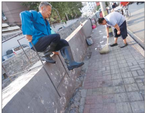
怕风把垃圾吹进河道，在河道两边做生意的摊主也主动把垃圾扫起来。