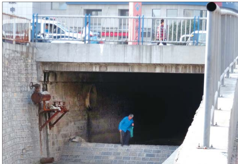
老陈负责羊头峪西沟500多米河道的保洁工作。