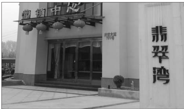
翡翠湾小区营销中心。