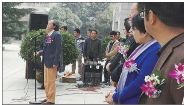
国际书法家协会主席、《中国书法全集》总编刘正成讲话。