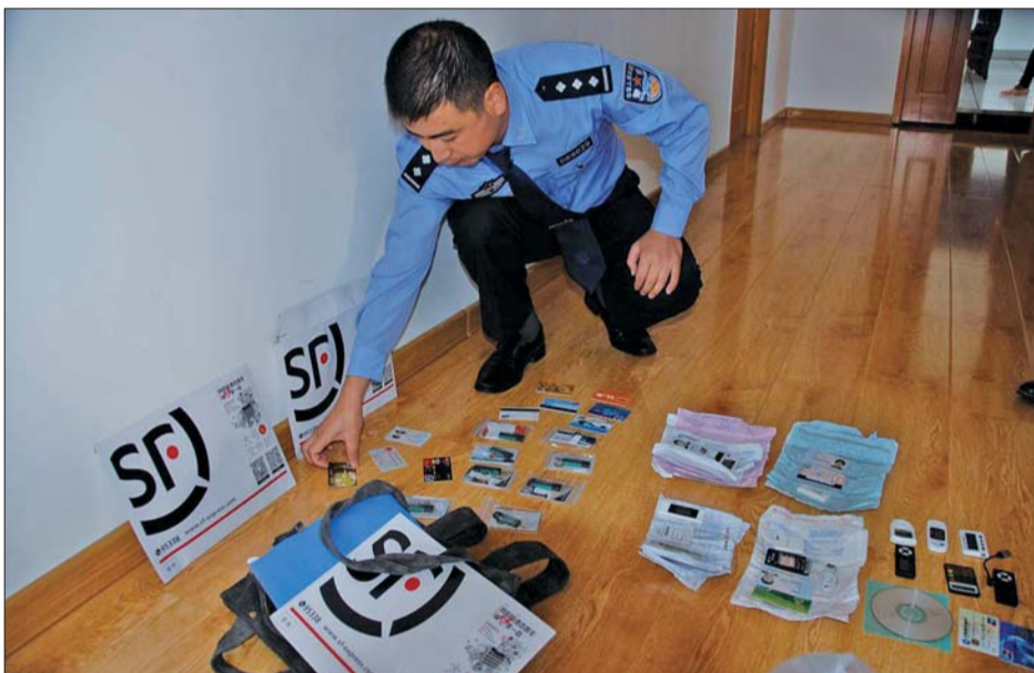
▲民警查获的信用卡以及涉案物品。

的银行卡,“小兵”只需提供银行卡、密码、开户人的身份证号即可,对这种卡,王某以每张100元的价格购进,再以每张150元的价格卖出;另一种“货”是成套银行卡,即银行卡及密码、U盾、开户人身份证原件或复印件,开户手机卡,对这种套