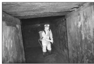
工作人员前期对汉墓进行人工喷淋。(资料片)

“该陵墓在中国考古界引起极大轰动的便是黄肠题凑‘墓葬’。”工作人员称,这是国内已经发掘的黄肠题凑类墓葬中规模最大、规格最高、结构最独特、保存最完整、最具代表意义的一座,具有重要的科学价值和历史价值。