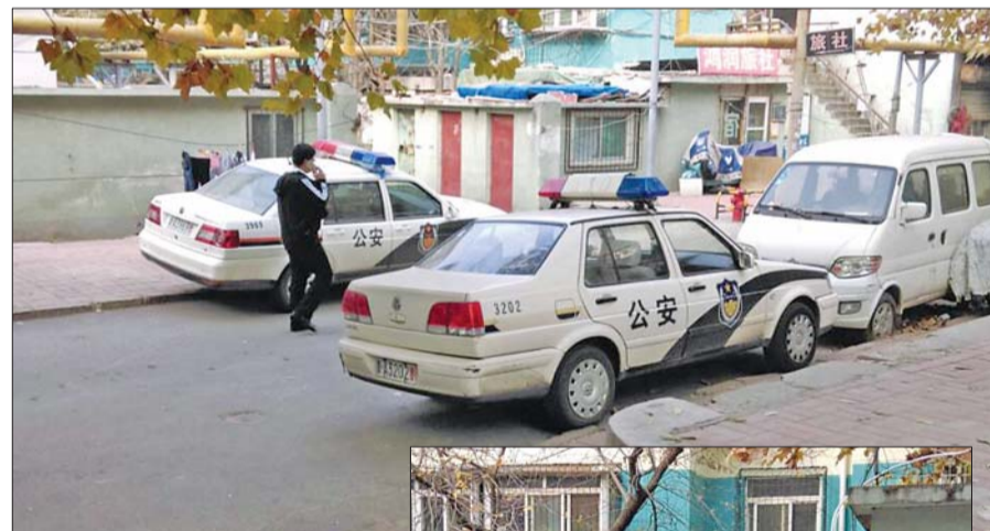
▲4日上午,现场被封锁,市中公安正介入调查。