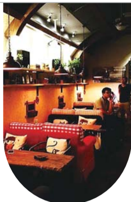
▲怀旧酒吧里摆着各种物件。

守着这么文艺的环境,如果只是喝咖啡和发呆确实有些可惜。恰逢周六,咖啡馆二楼便坐着许多不仅喝咖啡的人。有些在进行面试,有的在谈生意,还有人包下了某个区域的四五张桌子,准备开个小会。