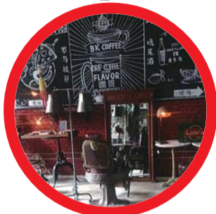
◀咖啡馆里的复古理发椅。