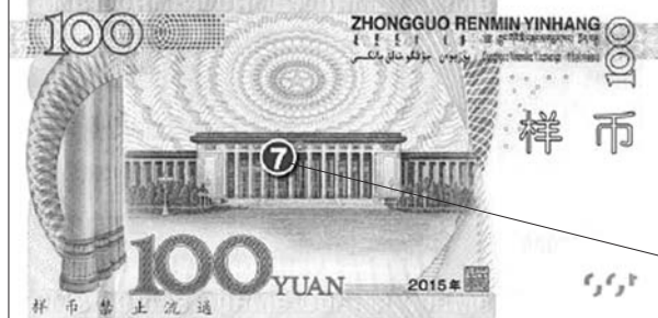
7. 雕刻凹印。票面正面毛泽东头像、国徽、“中国人民银行”、右上角面额数字、盲文及背面人民大会堂等均采用雕刻凹印印刷。