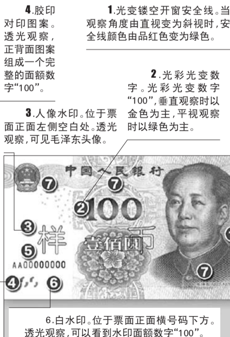
6. 白水印。位于票面正面横号码下方。透光观察,可以看到水印面额数字“100”。