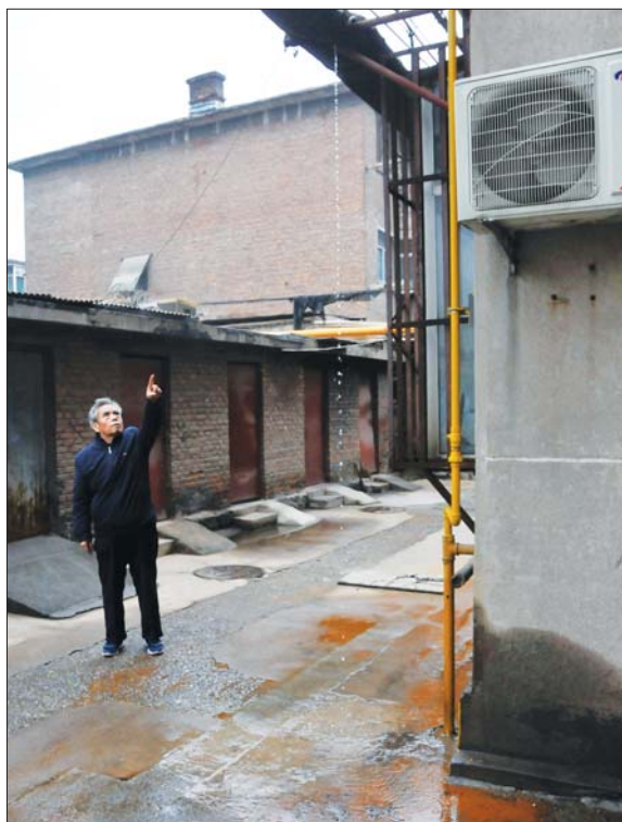
市公安局二宿舍外一供暖管道出现漏水。