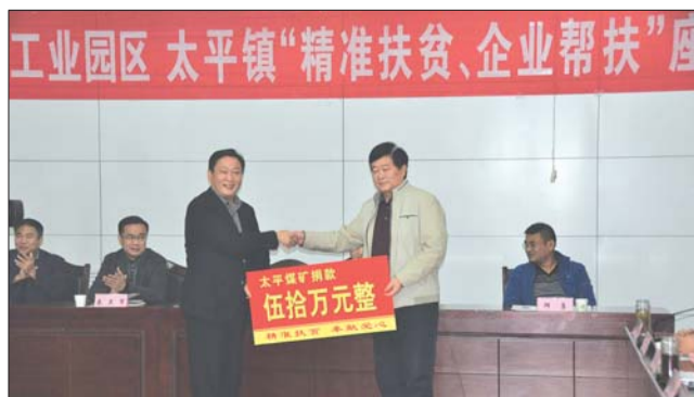
—企业捐款伍拾万元。

据悉,邹城工业园区太平镇将安排专人实行跟踪对接,管理好、发挥好、使用好所有的慈善捐款,确保所有善款全部用于困难群众的救助,并将资金流向及时、详细向捐赠企业反馈。