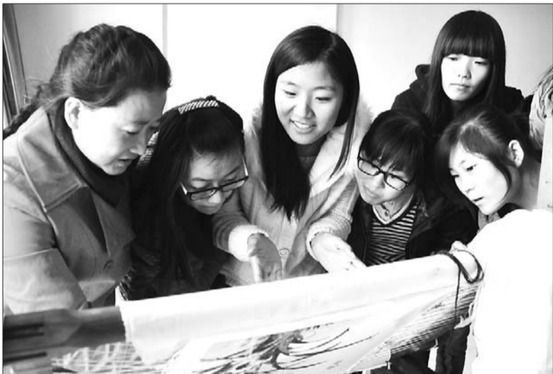
传承人现场教大学生学习简单的圣绣(资料图)。

本报济宁11月18日讯(记者汪洸 通讯员蒋琰) 第二届山东省文化创新奖公示日前结束,在所公示的30个项目中,济宁的保护与传承非物质文化遗产“三合六进”模式等三个项目首次成功入选。 济宁的三个项目包括,济宁职业技术学院、市文广新局和市群众艺术馆的依托职业院校保护与传承非物质文化遗产“三合六进”模式,汶上县广播电视台的全国广播惠农工程“汶上模式”,以及邹城市文广新局、邹城市文化馆的邹城县域公共文化服务政府购买模式实践创新。 记者了解到,像济宁职业