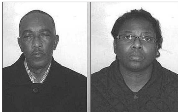
涉嫌奴役非法移民的英国夫妇

就这样过了10年。2015年,伊努克看到媒体有关当代奴役事件的报道,他意识到自己实为奴隶,遂再次向英国警察厅报案。(宗禾)