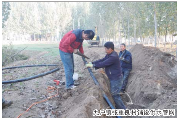
九户镇张重良村铺设供水管网

自11月1日起,邹平县自来水公司服务窗口正式入驻城南新区县政务服务中心,服务窗口位于一楼办事大厅128号、129号,方便群众就近缴费。