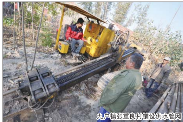
九户镇张重良村铺设供水管网

同时,为保证农村饮用水安全,让老百姓喝上优质的自来水,邹平县自来水公司下大力气建设农村供水管网并升级改造,目前已覆盖多数乡镇。正在建设中的九户镇农村供水管网一期工程已基本完工,共敷设管线2万余米,九户镇的十个村实现了通水工作。目前,九户镇二期工程正在进行中。