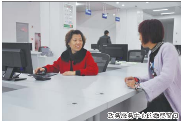
政务服务中心的缴费窗口

同时,为保证农村饮用水安全,让老百姓喝上优质的自来水,邹平县自来水公司下大力气建设农村供水管网并升级改造,目前已覆盖多数乡镇。正在建设中的九户镇农村供水管网一期工程已基本完工,共敷设管线2万余米,九户镇的十个村实现了通水工作。目前,九户镇二期工程正在进行中。