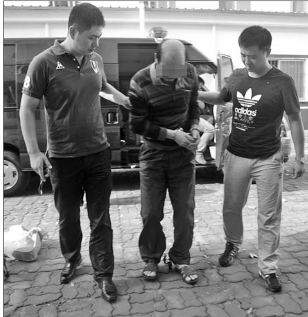
▲8月26日,汤某被押解回威海。