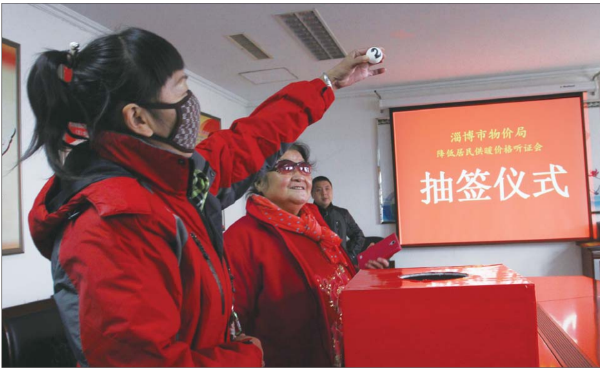
市物价局降低居民供暖价格听证会抽签仪式现场,居民代表展示她所抽到的签。