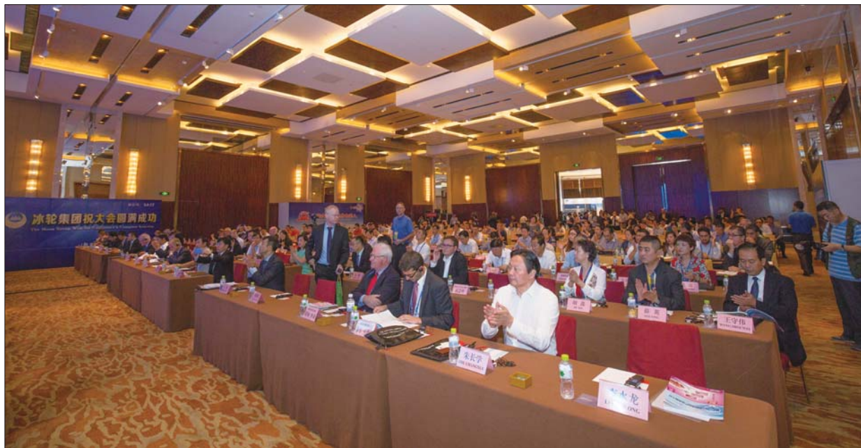
2015中国肉类食品产业发展大会现场。

近期，记者从世界肉类组织官方获悉，喜旺公司荣膺“世界肉类组织金牌会员”荣誉称号。喜旺公司于2003年加入世界肉类组织，成为中国首批加入世界肉类组织的成员单位。