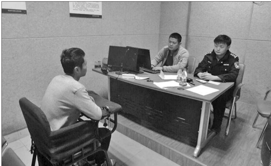
犯罪嫌疑人小张接受警方讯问。