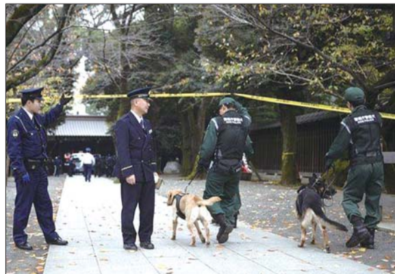
12月2日,日本警方在靖国神社内巡逻。

日本内阁官房长官菅义伟3日上午在例行新闻发布会上表示,可能会要求韩国方面协助调查。韩国外交部发言人赵俊赫说,韩国政府正密切关注相关报道,日方尚未正式告知调查结果或提出合作要求。他补充说,按照惯例,如果日方提出引渡要