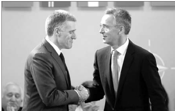
2日,在北约总部,黑山外长卢克希奇(左)和北约秘书长斯托尔滕贝格握手。