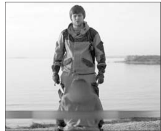
一名说俄语的“圣战士”站在俄“间谍”身后。

本报讯 “伊斯兰国”2日向俄罗斯传递了一个惊人信息,在其最新发布的视频中,一名俄罗斯“圣战士”斩首了一名俄罗斯“间谍”,并威胁称将袭击莫斯科、华盛顿和纽约。视频中,一名身穿橘黄色囚衣,身份不明的人质跪在地上,另一名身穿俄罗斯Gorka作战服,未戴面具的武装分子右手持刀。“今天,在这片神圣的土地上,(对抗俄罗斯的)战斗已经打响。”行刑的武装分子用俄语说道,随后割断了人质的喉咙将其斩首。