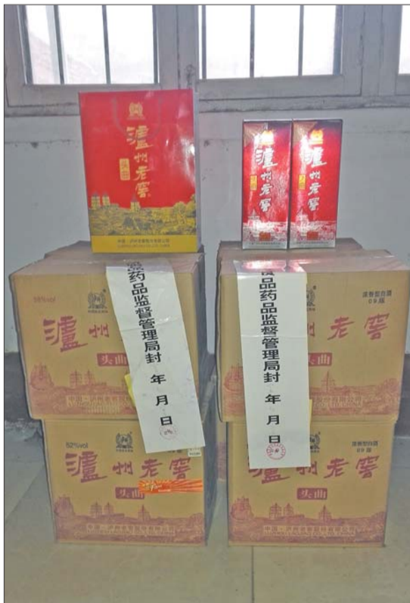
执法人员对涉事酒予以扣押。

经泸州老窖股份有限公司打假人员鉴定,这家店面经营的“泸州老窖头曲”未经“泸州老窖股份有限公司”授权许可,虚假标示了公司地址、联系方式、产品标准代号、生产许可证编号等标签内容,不属于泸州老窖股份有限公司产品。