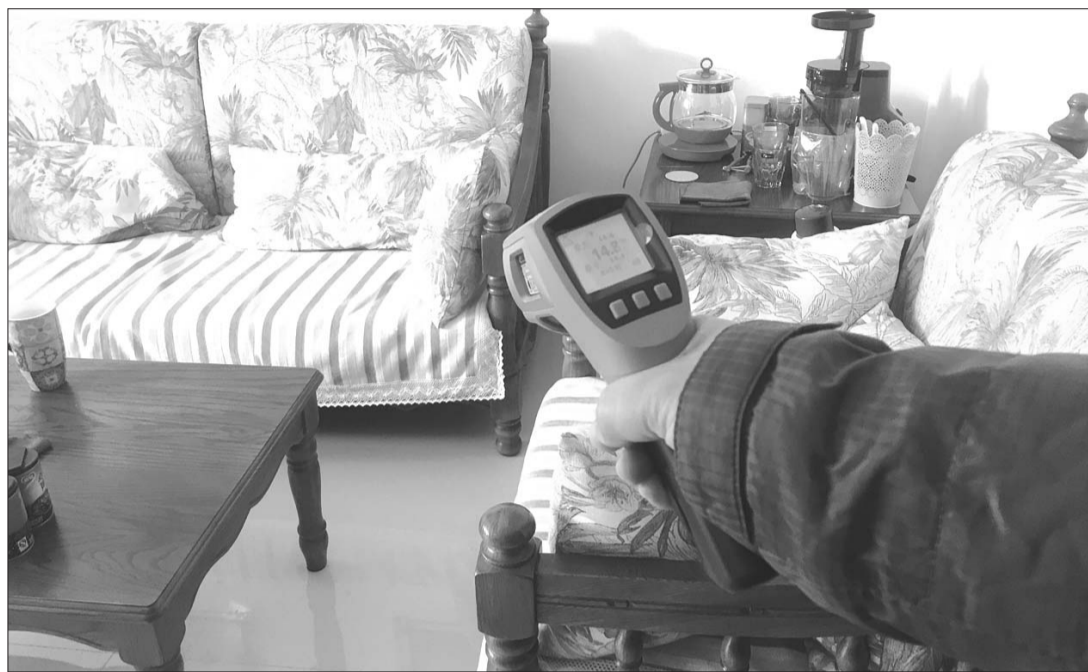
◀ 这户居民的室温只有14.7℃。

本报济宁12月3日讯(记者 庄子帆) 记者从济宁市市长公开电话办公室了解到,供暖以来,反映运河热力公司服务不及时问题的最多。3日,济宁市燃热办随机挑选了几个反映问题较集中的小区,入户了解市民用暖情况,解决用户家中暖气不热的问题。 “家里暖气片不热,多次打运河热力公司电话都没上门维修。”益民东区12号楼的一位大爷说。3日上午,市长公开电话办公室的工作人员、济