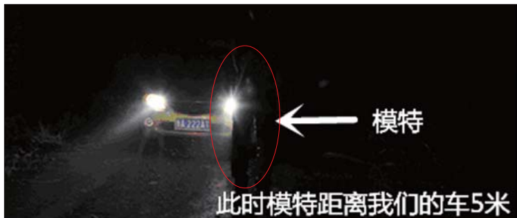
在远光灯照射下人眼瞬间“失明”,5米以上的距离根本看不清。

“一旦对于来车距自己的距离和车辆宽度作出误判,驾驶员往往就会采取错误的操作,导致事故的发生。”孙嘉说,尤其是新手,他们往往会产生慌张情绪,无法有条不紊地减速、控制方向,而多会由于紧张导致急刹车、猛打方向,这样对后车、相邻车道汽车,都是很大的威胁。