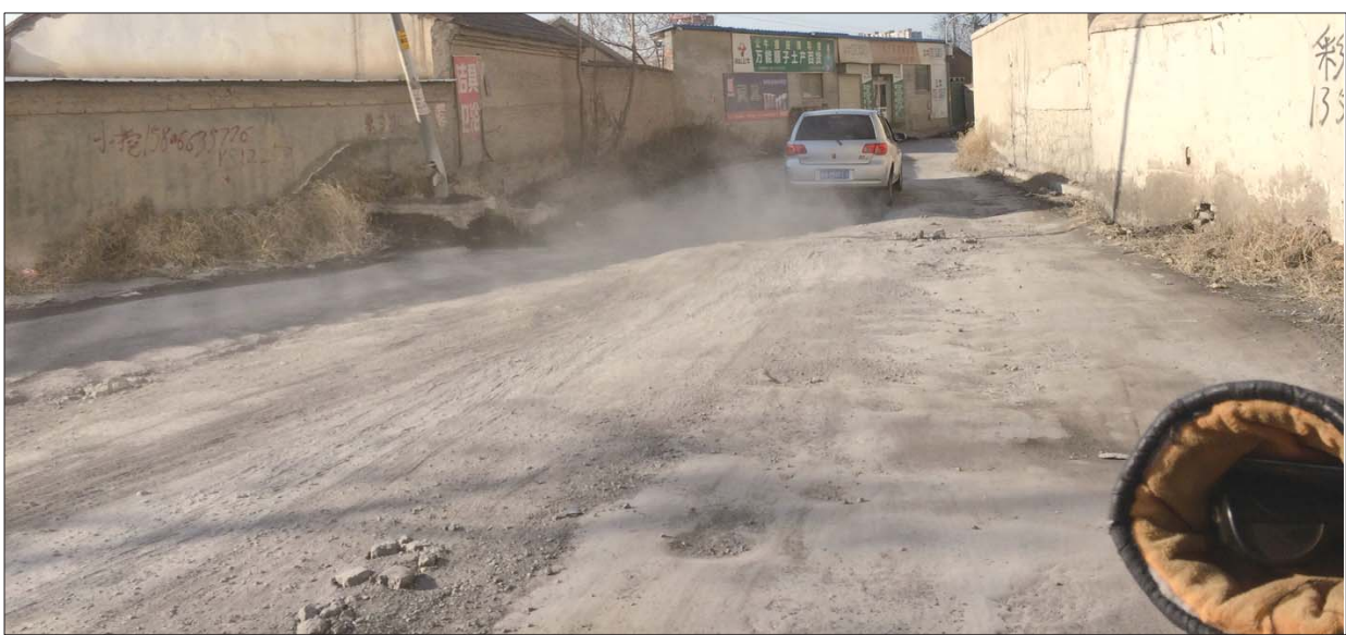
这条路已经没了原来的模样,早该修修了。

本报12月8日讯(记者 王小蒙) “这条路被大车轧坏好几年了,也没人修。”家住丁苑小区的徐先生反映,小区南边的西十里河东街破损已久,扬尘严重。