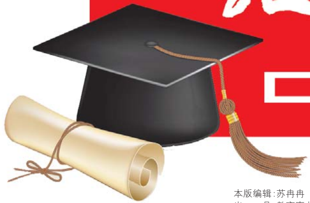
本版编辑:苏冉冉 组版:褚衍冲 出品:教育事业部