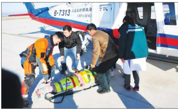
直升机将重伤员转移救治。

12月6日凌晨,交通运输部北海第一救助飞行队接辽宁海上搜救中心及北海救助局转威海市海上搜救中心救助信息,救助直升机再次起飞,先后飞往大连正东55海里海域处和威海正北30海里海域处,救助“辽大甘渔15216”