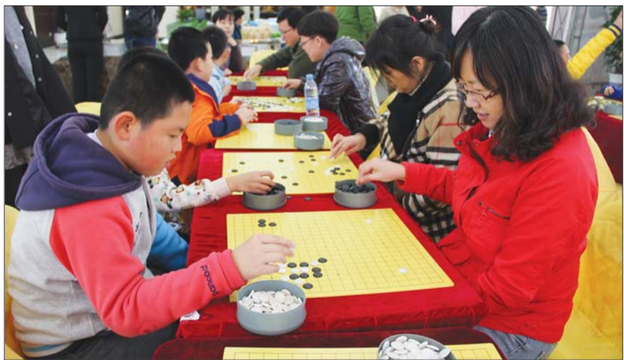
小棋手和妈妈下围棋。