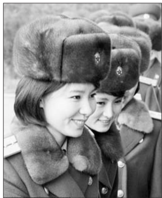
9日,牡丹峰乐团成员启程访华。

据新华社平壤12月9日电 由朝鲜劳动党中央宣传部第一副部长崔辉率领的朝鲜功勋国家合唱团和牡丹峰乐团9日从平壤乘专列启程访华演出。朝鲜劳动党中央书记金己男、中国驻朝鲜大使李进军等为访问团送行。