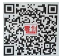
零创平台的微信二维码