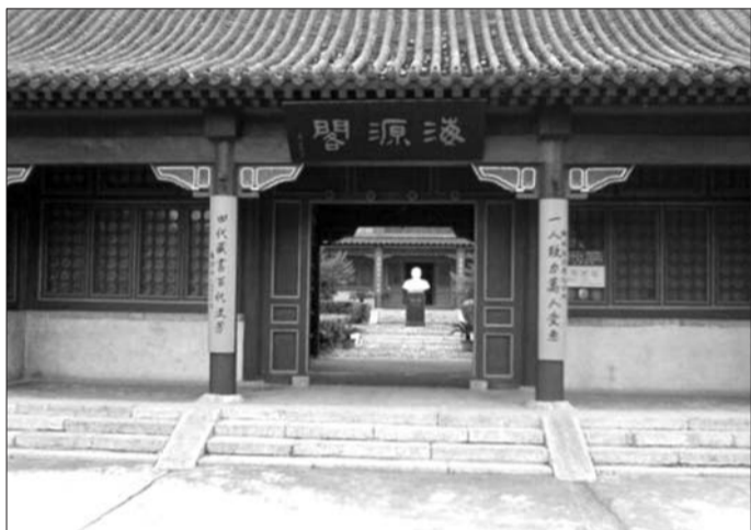
海源阁今景。(资料片)