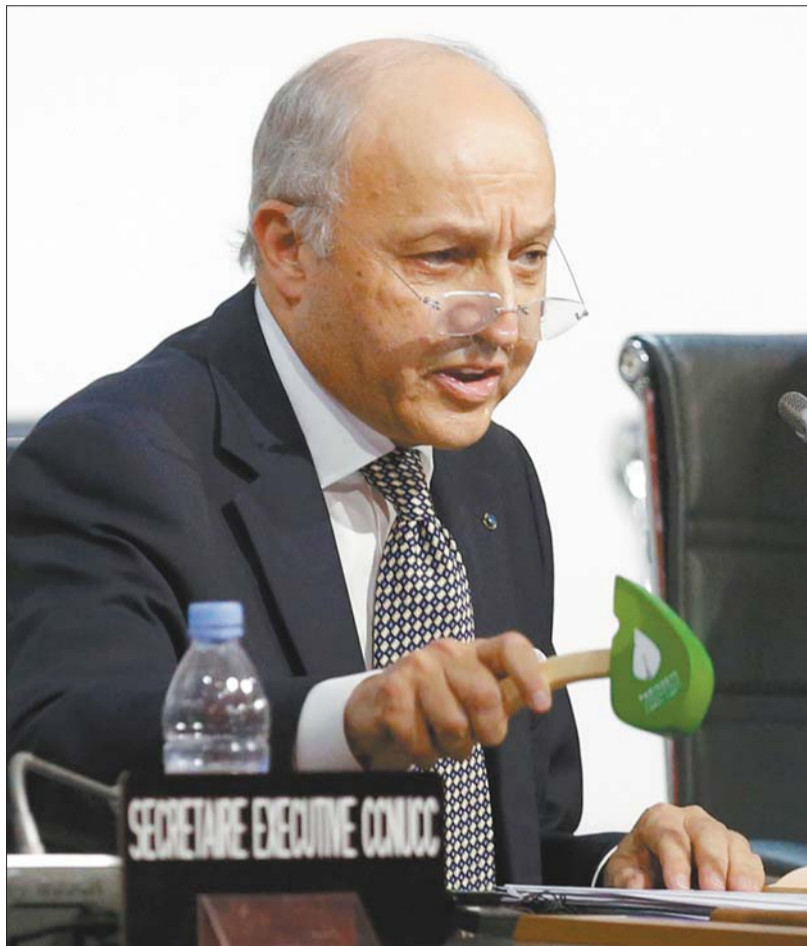
12日,法国外长、巴黎气候变化大会主席法比尤斯在会上落槌,标志着《巴黎协定》的达成。

巴黎时间12日19时26分,在延期超过24小时的巴黎气候变化大会最后一次全会上,大会主席、法国外长法比尤斯举起带有大会标志的绿色小槌,宣告里程碑式的《巴黎协定》诞生,《联合国气候变化框架公约》(以下简称《公约》)近200个缔约方代表全体起立鼓掌,庆祝全球应对气候变化进程迈出重要一步。预计这份协定将于2016年4月由各国领导人正式签署。