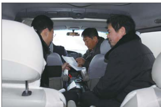
东里法庭的法官在下乡办案的车上开庭务会。