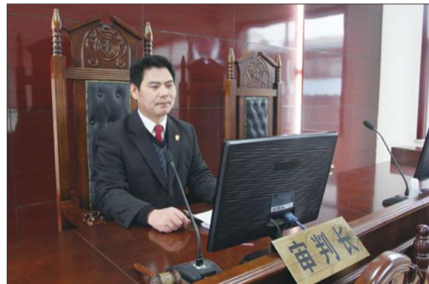
齐元林法官在法庭开庭。