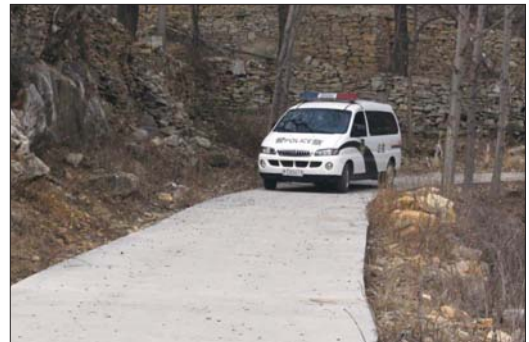
车子行驶在山路上。