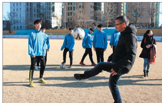
17日,在济南七中,来自塞尔维亚的足球教练第一次带队训练,在球场上秀球技。

据悉,近年来,国内多个城市也启动了复古“铛铛车”项目,各具特色的“铛铛车”走上了北京、上海、香港等城市的街头,成为一道亮丽的城市风景线。