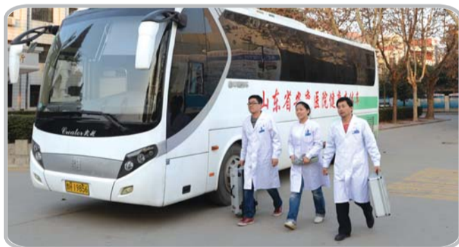
健康查体车义诊惠民