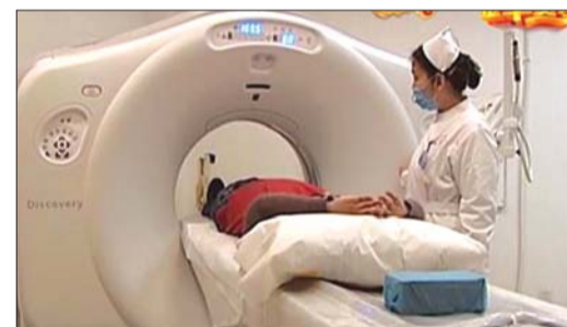
世界最先进的宝石能谱CT。

早在2012年,兖矿集团总医院放疗科开始创建癌痛规范化治疗示范病房(GPM),对所有癌性疼痛患者给予规范滴定、宣教和生活、心理护理,累计管理癌痛病人近千人次,癌痛控制率达到100%,吸引了济宁、泗水、曲阜、兖州等周边地区的医疗机构多次来考察学习。