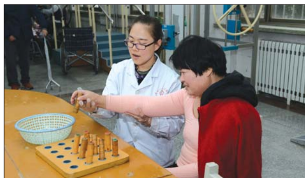
康复治疗师正指导患者康复训练。