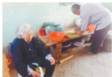
本报记者 张帅 实习生 于亚非 整理