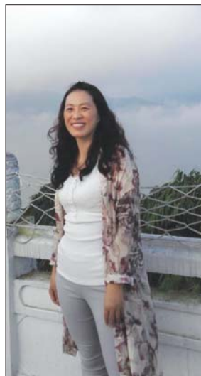
今日C01—C04版 本版编辑:李怀磊 组版:郑文