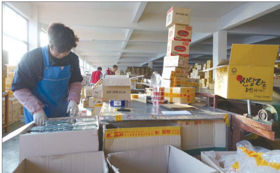
12月21日,威海一家进口食品电商的工作人员,在给购买韩国零食的网友发货。本报记者 任磊磊 摄

对国人来说,韩国零食也非常有诱惑力。中韩自贸协定(FTA)生效第二天,一艘满载威海九日食品有限公司的韩国进口柚子茶抵达威海海关。记者了解到,虽然该批货物是用的FTA原产地证进口,不过目前该原产地证暂不如《亚太贸易协定》下的亚太原产地证降税幅度大。记者了解到,在中韩自贸协定之前,我国已经与多个国家和地区有相关的自贸协定,部分涉及到对韩贸易的协定关税可能优惠于刚刚诞生的FTA。在两者并行的情况下,贸易公司会择优使用。