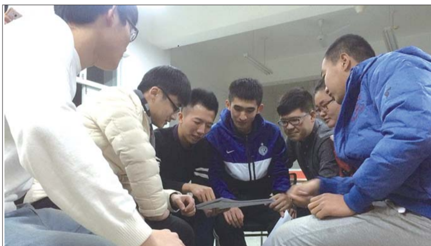
聊城7位大学生众筹开社交主题餐厅,获得全国青年创业大赛金奖。