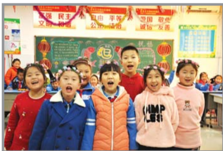
济宁学院附小科苑校区三年级3班学生

“你们都有什么新年心愿呀，说出来会更容易实现哦。”在三年级3班的元旦联欢会上，当老师问起新年心愿，小朋友们争先恐后地把小手举得老高。