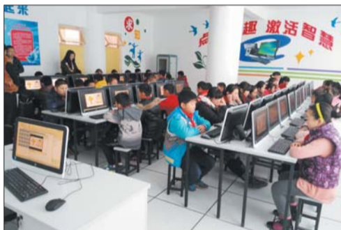
珠玑小学学生在爱心计算机教室上课。

自2010年以来,季道全先生已个人出资近80万元,先后为珠玑小学捐建了“拥有三台高清摄像机的多功能录播教室”“拥有50台快易典平板的智慧教室”“拥有50台一体机的多媒体计算机网络教室”,如今的珠玑小学,办学硬件设施已居全区前列,为师生成长搭建了更为宽广的平台。2012年,学校成为芝罘区8所教育信息化试点学校之一;2013年,被烟台市教育局授予“教育信息化建设和应用先进单位”;